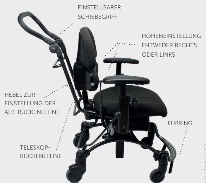
VELA Tango 500EI mit Zubehör

Das Besondere an der ALB-Rückenlehne ist, dass die Muskelgruppen in der Lumbal-, Becken- und Bauchregion aktiviert werden was die Korsettzone stärkt und so zu einer besseren Haltung führt.