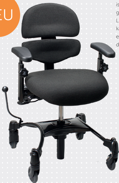
VELA Tango 500 mit kleiner ALB-Rückenlehne

Die Rückenlehne mit aktiver Lumbalstütze (ALB) ist eine einzigartige zweiteilige, ergonomisch geformte Rückenlehne. Sie besteht aus einer Lumbalstütze und einer Rückenstütze und kann individuell auf die optimale Sitzposition eingestellt werden. Die ALB-Rückenlehne ist in drei unterschiedlichen Größen verfügbar.