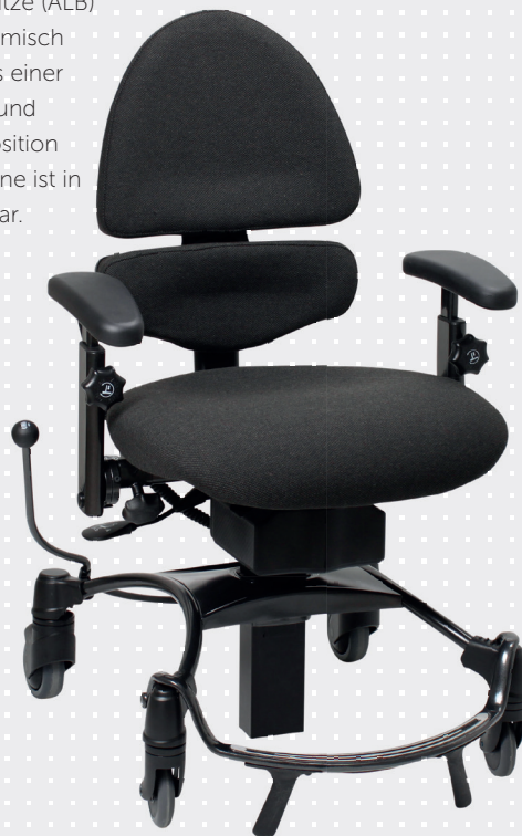
VELA Tango 500E mit mittlerer ALB-Rückenlehne

(Der Fußring kann separat geordert werden)